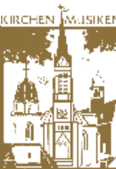
SANKT NICOLAI FRIEDENSKIRCHE & KLÖSTERLEIN FRIEDLAND

Montag 3.12.2018, 19.30 Uhr, Friedenskirche